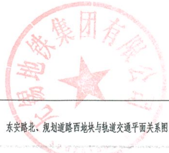
附图名称： 东安路北、规划路西地块与轨道交通平面关系图